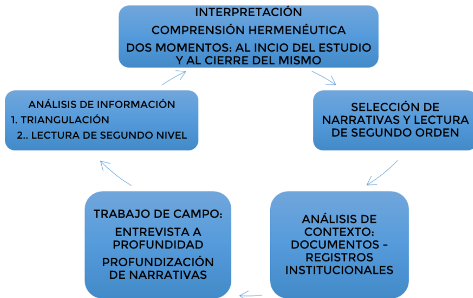
Figura 1. Proceso de selección y documentación de experiencias

Por todo lo anterior, la propuesta metodológica que desde Eisner orienta un estudio hermenéutico comprensivo para la documentación de 20 experiencias significativas en evaluación de los aprendizajes de las IE, se sintetiza en la siguiente figura: