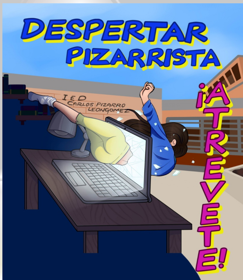
Imagen diseñada por Katerine Guayazán

Finalmente se pretende rendir un homenaje a todos los orientadores que han pasado por el colegio dejando huella y poniendo no solo su formación profesional sino su vida misma al servicio de los niños y niñas más vulnerables de la institución acompañándolos a ellos y a sus familias intentado ser luz, compañía, comprensión y amor en momentos en los que la vida se vuelve difícil de seguir afectando la capacidad de aprender.