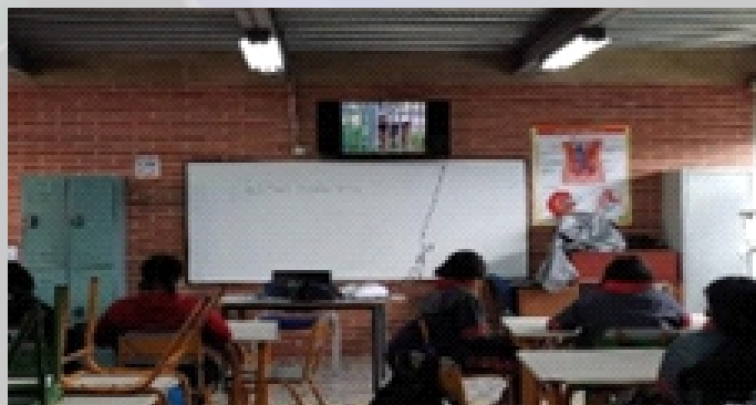
Charla de sensibilización- Proyecto Pro-perro. Colegio Francisco Primero S.S (I.E.D)