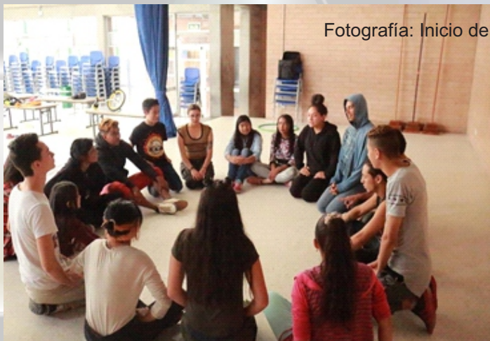
Fotografía: Inicio de sesión de actividad. Baracaldo (2017)

Para ello, el Centro de Interés Pachamama ha programado una serie de eventos pedagógicos, lúdicos, artísticos y comunitarios, llevando el Proyecto Educativo Institucional (P.E.I) más allá de los muros de la institución bajo el concepto de aula abierta como lugar de construcción y resignificación de la vida cotidiana.