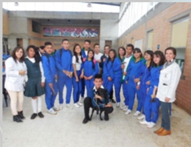
Primer Semillero “Comité Estudiantil Pro-perro” atención médica de Lula.

aprendo a respetar mi entorno, puedo generar niveles de convivencia diferentes, más tolerantes, y tendientes a fortalecer las bases de una sociedad más amable”. Así pues, se inició con una colecta para llevar a una perrita al veterinario, se realizaron unas alcancías alusivas a los animalitos (previa autorización de las directivas de la institución). Los estudiantes se animaron a pedir a sus compañeros pequeñas cantidades de dinero para llevar a cabo la noble labor. De dicha colecta, sumado a un aporte hecho por las docentes, se logró la