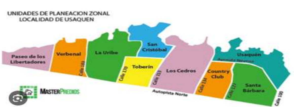
Gráfico 2. Ubicación de la UPZ Verbenal en la división política de la Localidad de Usaquén.