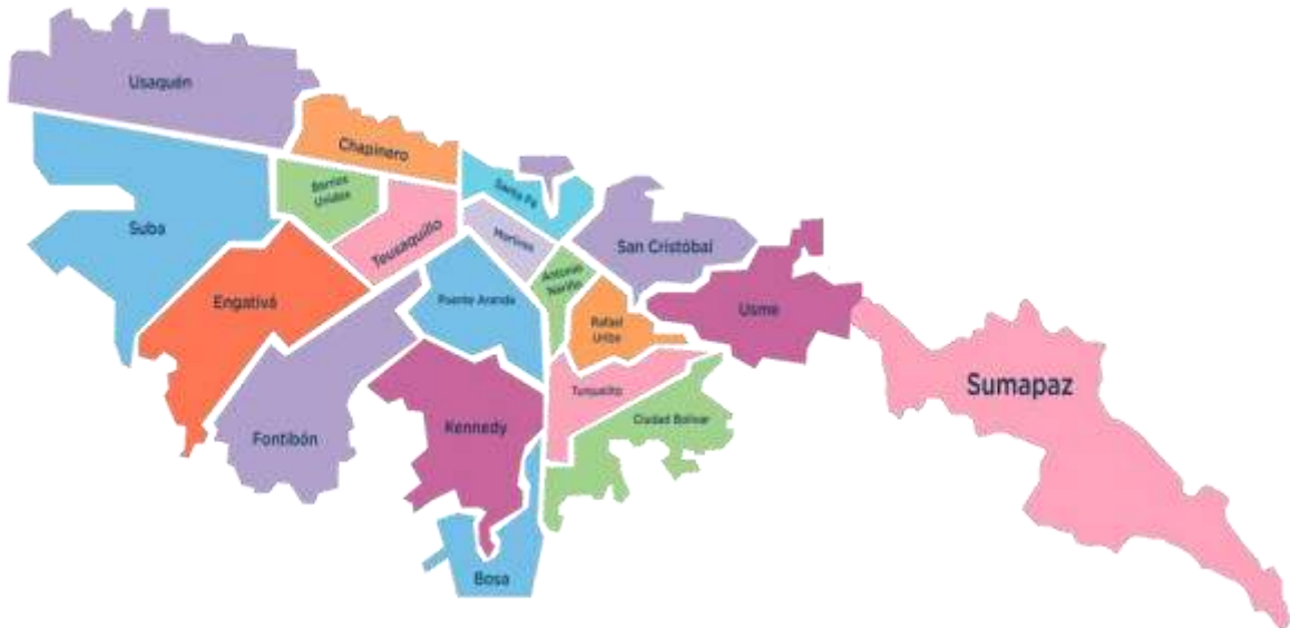
Gráfico 1. Ubicación de la localidad de Usaquén en Bogotá.

Usaquén (localidad 1 de Bogotá) es una zona nororiental de alta plusvalía, caracterizada por su mezcla de arquitectura colonial en la plaza fundacional y desarrollo moderno, comercial y residencial. Cuenta con cerca de 600,000 habitantes, con presencia de estratos medios-altos, una importante zona rural en los cerros orientales y una fuerte dinámica gastronómica, turística y empresarial.