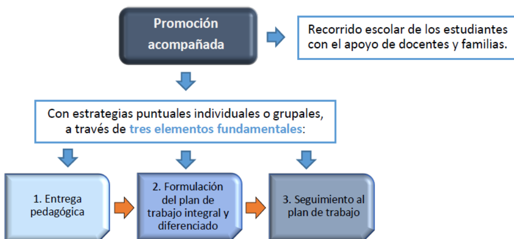
Figura 1: Elementos de la promoción acompañada

La siguiente figura nos recuerda los componentes de la promoción acompañada, sobre los que analizaremos avances y aprendizajes.