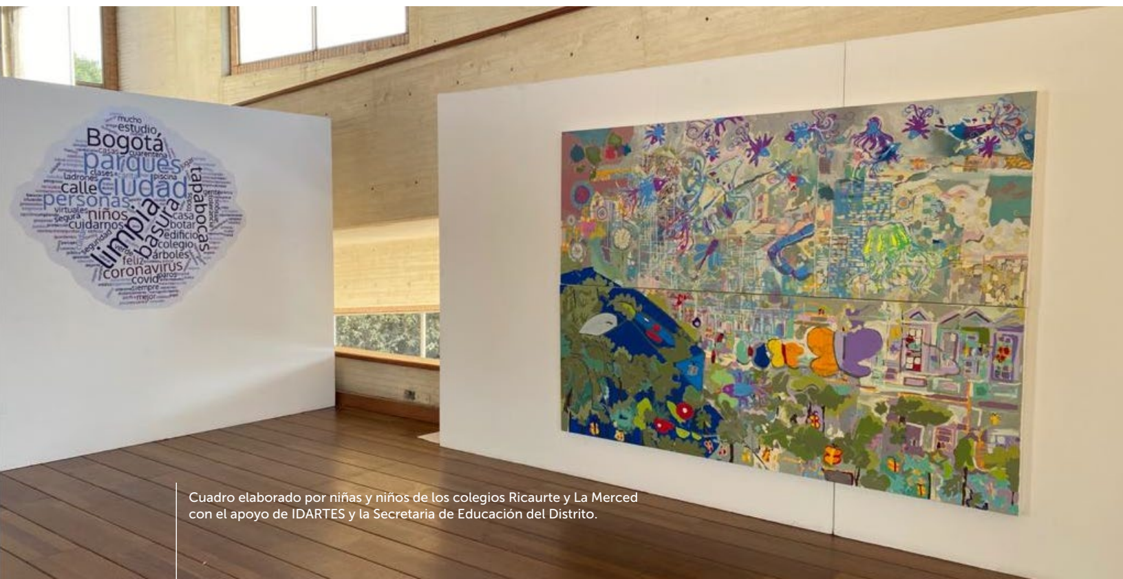
Cuadro elaborado por niñas y niños de los colegios Ricaurte y La Merced con el apoyo de IDARTES y la Secretaria de Educación del Distrito.